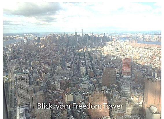
Blick vom Freedom Tower